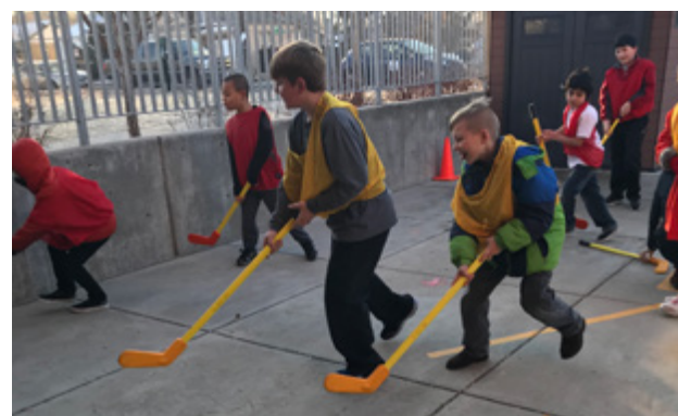
Jugando al hockey en P.E. Adaptada