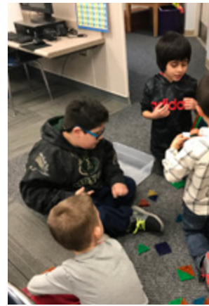
Construyendo una impresionante torre

Tenemos un grupo INCREÍBLE de estudiantes en las aulas de Apoyo de Conducta este año escolar. ¡Trabajan muy duro y están mejorando tanto! No podemos esperar para ver más de sus progresos.