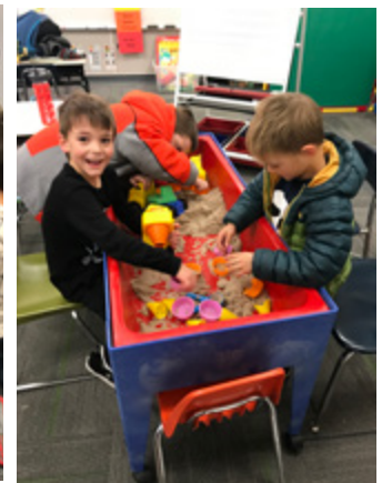
Disfrutando de la mesa de arena