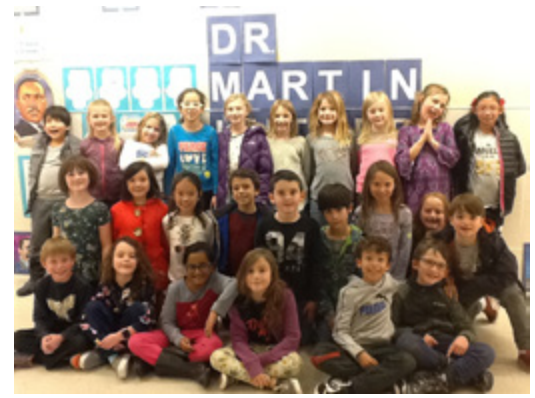
Fotos from Sra Pizzaro's clase por Martin Luther King Day y con esqueletos.